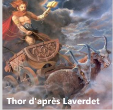
Thor d'après Laverdet