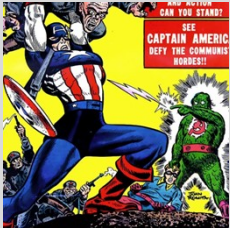
Défense contre les attaques du communisme contre la Terre qui représente les États-Unis

Les Communistes sont tournés en ridicule mais n'en sont pas moins une menace qu'il faut détruire.